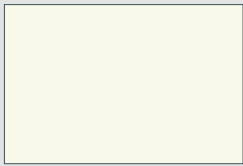
Platinweiß W980 ST2