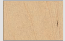
Mandel Ahorn natur H3840 ST9