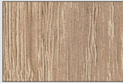
Bardolino Eiche natur H1145 ST10