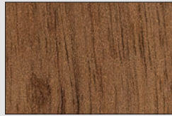
Dijon Nussbaum natur H3734 ST9