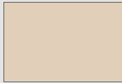
Sandbeige U156 ST9