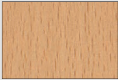
Elmau Buche natur H1582 ST15

Um die motorische Wandhalterung besonders gut in bereits bestehende Einrichtungen zu integrieren, können die Pulverbeschichtung der Säule nach RAL Classic, sowie die unten aufgeführten Dekore der Frontblende individuell an jeden Raum angepasst werden.