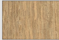
Hamilton Eiche natur H3303 ST9